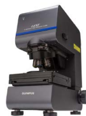
3D測定レーザー顕微鏡 (OLS5000)